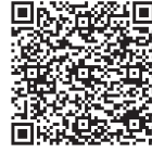
お申し込み専用フォーム