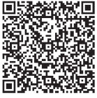
横浜市HP「対象施設一覧」

※お申し込み後、参加決定通知書をメールでお送りします。※2週間程度お時間をいただく可能性があります。